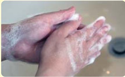
手のひらをまんべんなく洗います