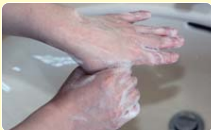
親指や手首も忘れずに洗います