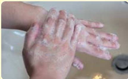
指のつけねや手の甲などを洗います