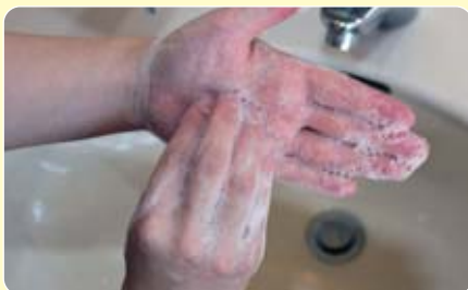
指の先や爪もよく洗います

流水で石鹸をよく洗い落とします 手を拭くときは、タオルやハンカチの共有はやめましょう