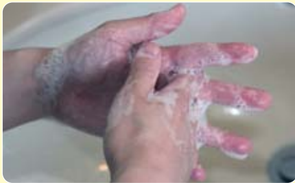
指の間をよく洗います