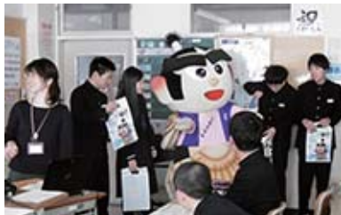
▲とても勉強になったでござる

厚岸中学 校2年生の 22人の生徒 たちも、授 業に真剣に 取り組んで いて、感心 したのでご るなり♪ また授業 に参加して、みんなと一緒に学習し たいでござるよ！