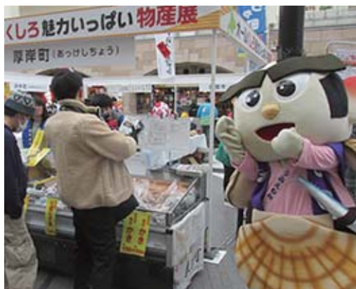
▲厚岸町のブースは大人気！

「厚岸のカキは濃厚でおいしい！」、「厚岸のアサリは大粒で食べ応えがある！」などと声をかけてくれて、道央圏でも厚岸の味覚は大人気であることを実感することができたでござる！