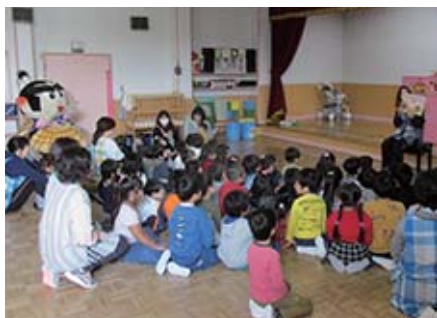
▲楽しい時間はあっという間！