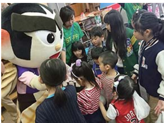
▲お友達がたくさんできたでござる！

このイベントは子どもたちの笑顔のために、ママたちが企画・運営をしたイベントで、フリーマーケットやフードコーナー、特産品が当たる抽選会など、どれも魅力的でござるな〜♪