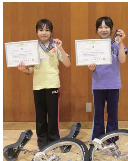
姉妹そろって全国3位