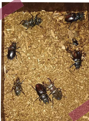
上尾幌でのクワガタ採り

厚岸町地域おこし協力隊facebookページも見てね! https://www.facebook.com/akkeshi.chiikiokosi/