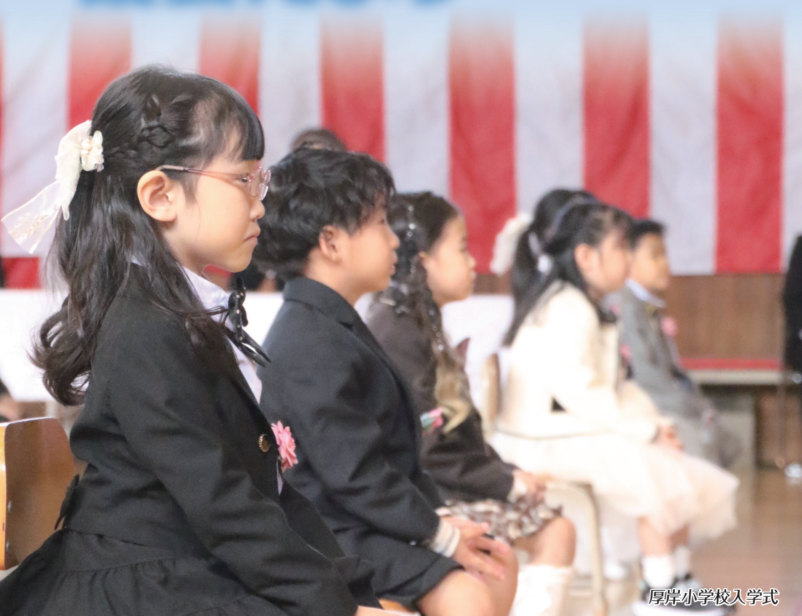
厚岸小学校入学式