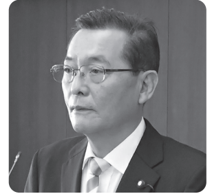
南谷 健 議員