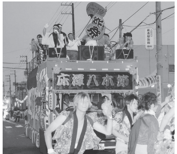
夏祭りの床潭八木節

◎ 床潭地区で傳承されてきた踊りで、地域の歴史を伝える郷土芸能の一つであると考えています。これを傳承して