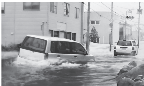
津波シミュレーション動画 危険な自動車による避難

○ 批判は甘んじて受ける。町民の防災に対する意識云々の前に、職員の意識改革が急務だと考えている。そこから進めて行きたい。