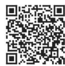
▲申し込みはこちら

している人やその家族など ● 相談例 / 不動産取引に関する相談、相続や登記に関する相談、解体に関する相談など ● 申し込み / 専用フォームから申し込み