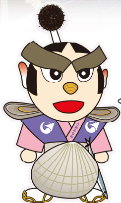
厚岸町公式キャラクター 「うみえもん」

5月9日~17日に、 子野日公園で『第77回あっ けし桜・牡蠣まつり』が開催され たのでござる！いろいろな人に会えて 嬉しかったのでござるな♪バーベキュ ーの匂いを嗅ぐと、お腹がすいて拙 者も食べたくなつたのでござるよ。 夜桜と弁天神社のライトアップ もとても綺麗だったのでござ るな！