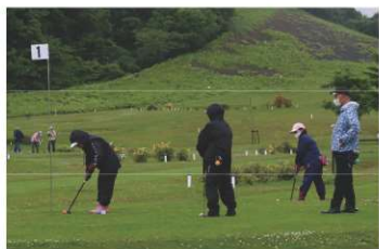
▲令和7年パークゴルフ大会の様子