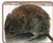
エゾヤチネズミ (体長10cm程度)