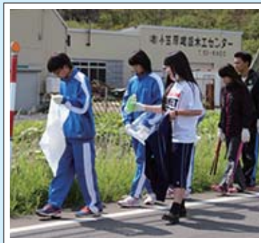
【平成26年度4校クリーン作戦の様子】

種間での理解を深めていきましたが、児童生徒間の交流も図ってほしいとの声が上がリ、昨年度からこの取り組みがスタートしました。